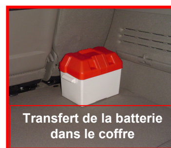
Transfert de la batterie dans le coffre