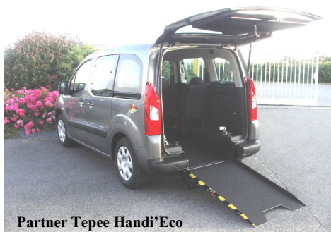
Partner Tepee Handi'Eco

Grâce à son décaissement (Handi'Eco), les véhicules Partner et Berlingo permettent une accessibilité aisée pour une personne en fauteuil roulant et conserve l'esthétique d'origine.