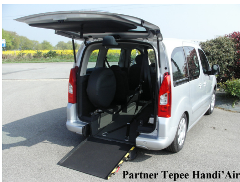
Partner Tepee Handi'Air

Devis gratuit par type de véhicule - Nous questionner avant toute acquisition.